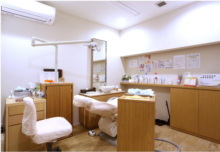
ホワイトエッセンス八乙女の施術は女性 歯科衛生士が担当。落ち着いた完全個 室で、丁寧なカウンセリングから始める