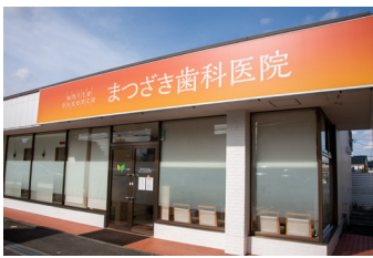
医院の前に10台分の駐車場スペース が用意されている